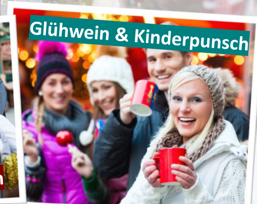
Glühwein & Kinderpunsch