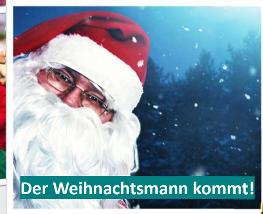
Der Weihnachtsmann kommt!